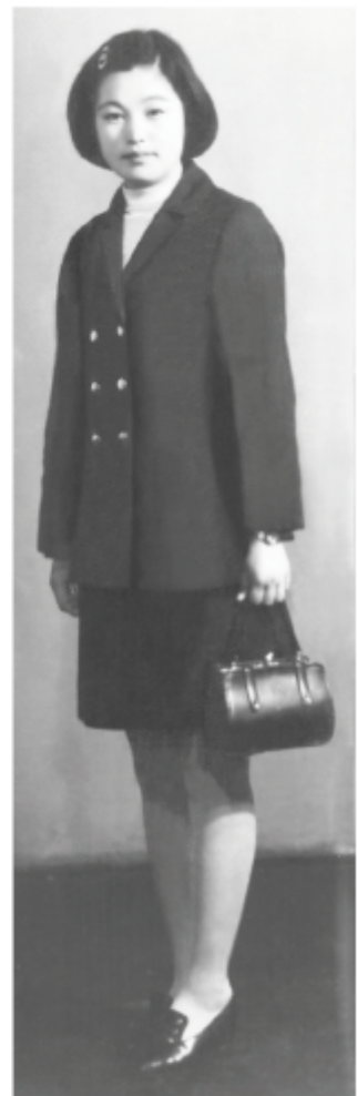
Julia dans sa jeunesse